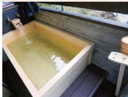
和室B(客室露天風呂)