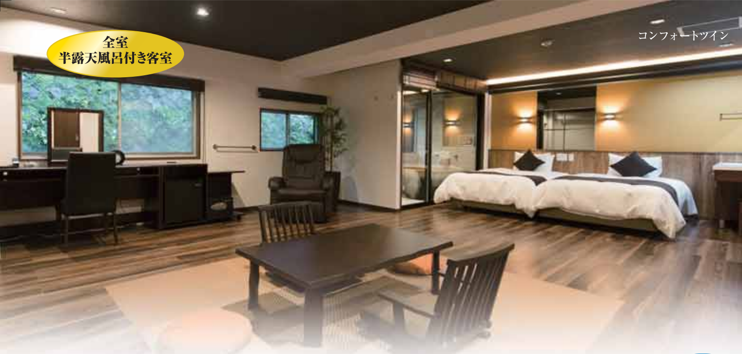
コンフォートツイン