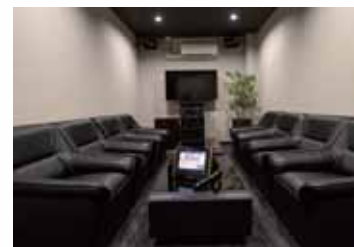
二次会などにもお気軽にご利用ください