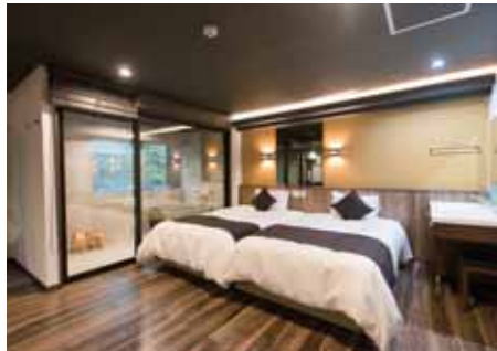
コンフォートツイン