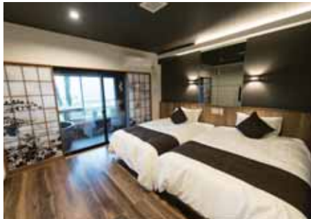
プレミアムデラックスツイン

■源泉名/大涌谷温泉 ■泉質/酸性 低張性 高温泉 ■鉱泉分類/酸性-カルシウム-硫酸塩・塩化物温泉