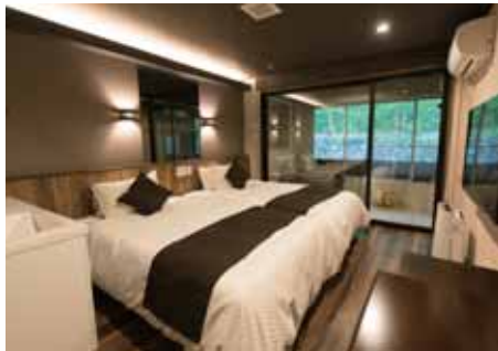
エコノミーツイン