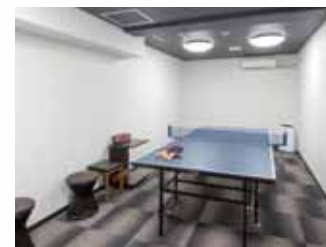
家族でワイワイ楽しめます