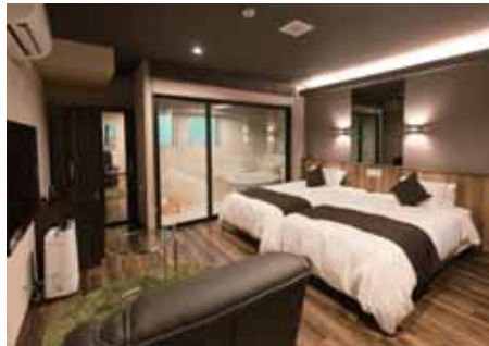
デラックスツイン