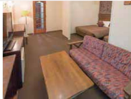
プレミアムツイン