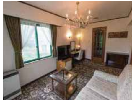
デラックス和洋室