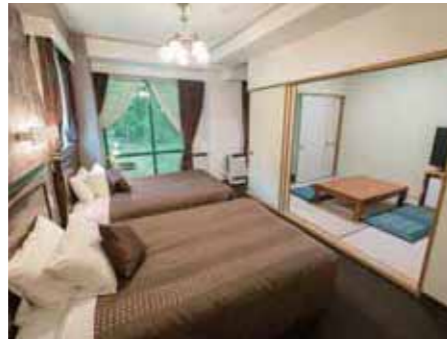
プレミアム和洋室