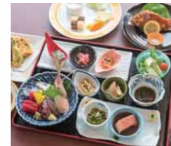
ビュッフェ(夕食一例)