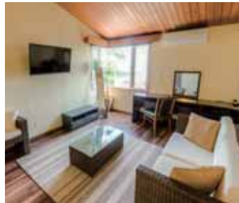
ツイン デラックス