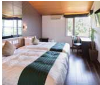
ツイン クラシック