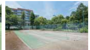
フットサルコート