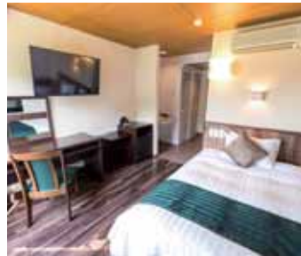
シングル スタンダード