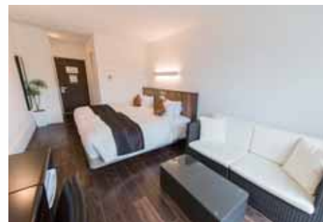
プレミアムツイン