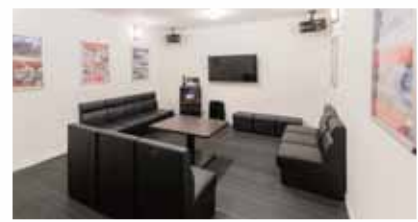
二次会などにお気軽にご利用ください