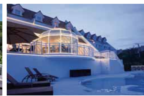
夜は幻想的なライトアップで酔いしれます