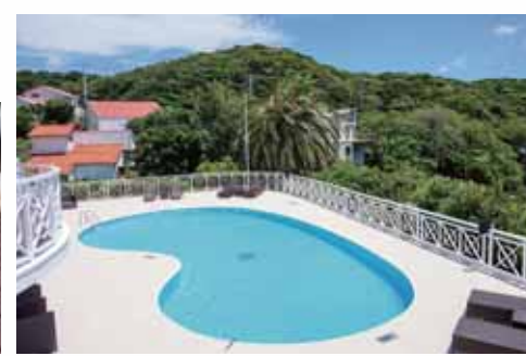
オーシャンビューは絶景です