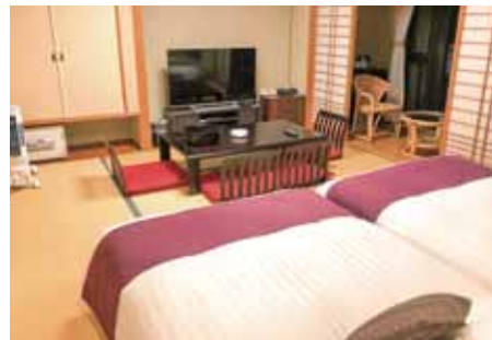
彩雲(和室) 客室露天風呂