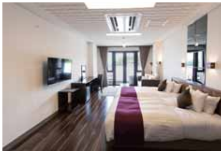
ツインデラックス 客室露天風呂