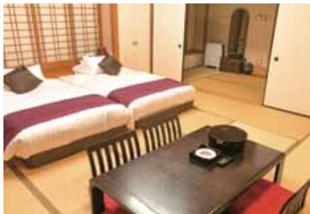
皓月(和室) 客室露天風呂