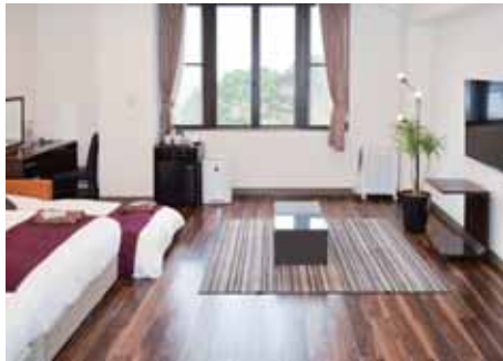
トリプルクラシック