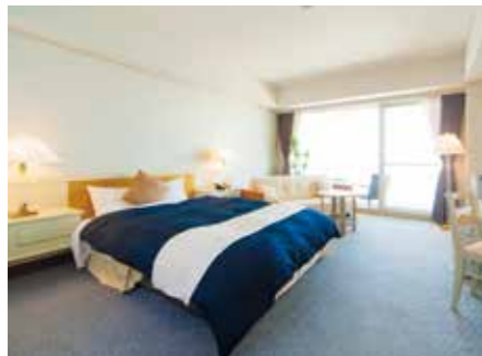
モデレートダブル

全室オーシャンビューの客室は、ゆったりくつろげる洋室の他、広々とした落ち着きある和室、ファミリーでお過ごしいただける和洋室、ラグジュアリーなスイートルームなどをご用意。海を眺めながら客室露天風呂も楽しめます。(客室露天風呂のない部屋もございます)