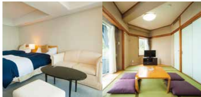
ファミリー和洋室