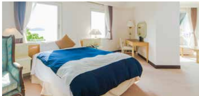
オーシャンスイート