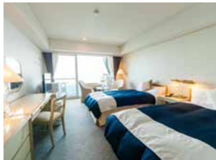
クラシックツイン