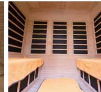
ドライサウナ(男湯)