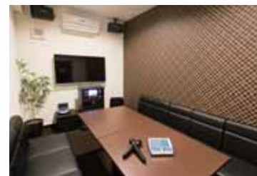
宴会の二次会などにもお気軽にご利用ください