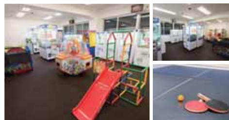
遊び盛りのお子様にも嬉しい施設