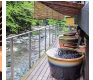
露天陶器風呂(男湯)