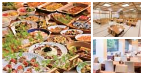
豊富なメニューをご用意しております