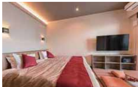
スーペリア和モダン