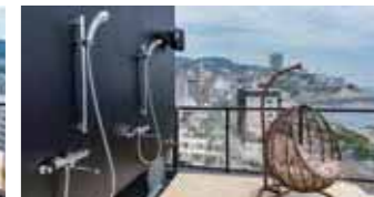
オーシャンビュープール