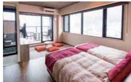
ジュニアオーシャンスイート