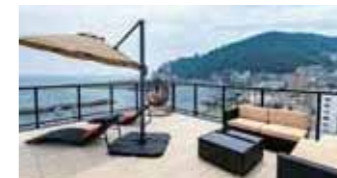
オーシャンビュープール

レストランを始め、オーシャンビュープールやカラオケなど 家族や友人で楽しめる付帯施設をご用意しています。