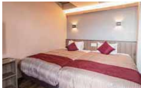
オーシャンスイート