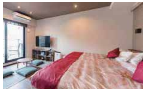
デラックス和モダン