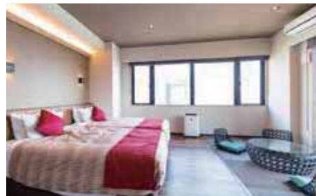
プレミアムオーシャンスイート

海、山と豊かな自然に囲まれた最高のロケーションの客室露天風呂。 全室シモンズ社製のベッドを導入し、心から安らげる空間でおくつろぎいただけます。