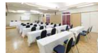
コンベンションホール