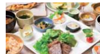
夕食ビュッフェ ※季節により異なります