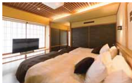
本館：プレミアムスイート【半露天風呂付】

レストランを始め、宴会場やカラオケルーム・足湯など 家族や友人で楽しめる付帯施設をご用意しています。