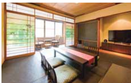
本館：モダン和洋室【半露天風呂付】