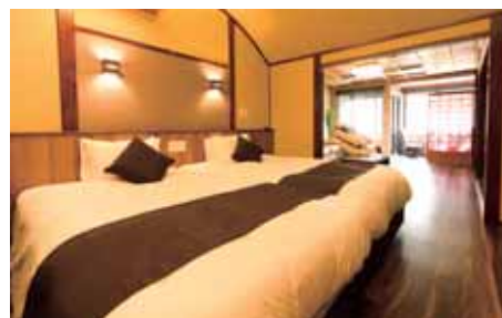
本館：ジュニアスイート【半露天風呂付】