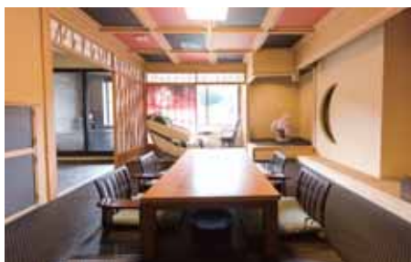
本館：デラックススイート【半露天風呂付】